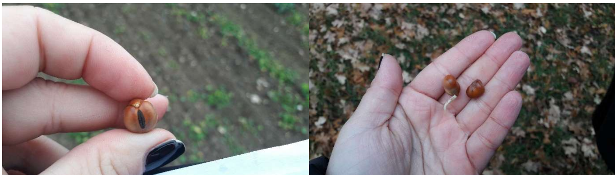
Ackerbohnenkörner zum Zeitpunkt der Erfassung von Bestandesdichte und Feldaufgang im Herbst 2017 am Standort Schönbrunn

An den Versuchsstandorten wurden einige Reihen der Winterparzellen aufgrund der schlechten Feldaufgangsergebnisse überprüft, wobei die im September-Anfang Oktober ausgesäten Leguminosenkörner unverändert oder mit kleinen Keimwurzeln gefunden wurden ( Fehler! Verweisquelle konnte nicht gefunden werden. ), was die Hypothese bestätigt, dass die Niederschlagsmengen an den Standorten für eine Keimung von großkörnigen Leguminosen offenbar nicht ausreichend waren.